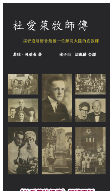
《杜愛萊牧師傳》即將再版