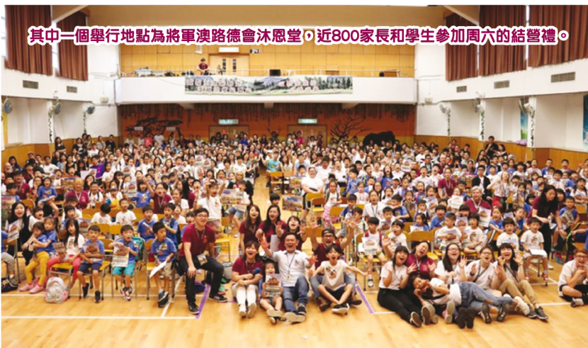
其中一個舉行地點為將軍澳路德會沐恩堂，近800家長和學生參加周六的結營禮。

在最近香港充滿不穩定的社會氣氛中，縱然百感交集，同工們仍然克守宣講福音。我們感恩能在暑假成功舉辦這活動。期望在下年度，暑期英文聖經班不單為兒童繼續舉辦，更看到青少年的需要，招募更多宣教師，爭取把這項活動擴展至青少年，讓青少年能善用時間，得着積極豐盛的能量，正向成長。